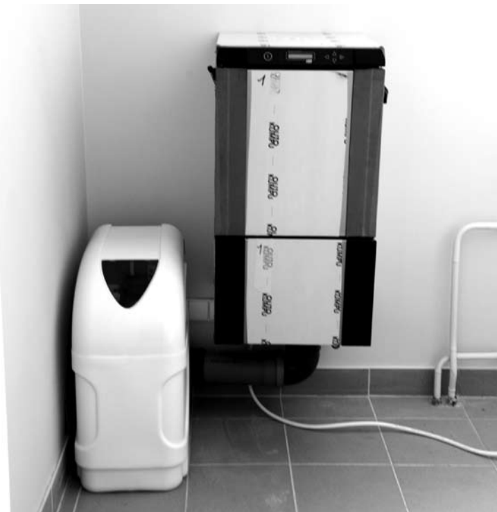
Palaikomojo gydymo ir slaugos paslaugas teikiančiai įstaigai buvo labai reikalinga basonų plovimo ir dezinfekavimo mašina.

Planuojama, kad šių metų liepos mėnesį Troškūnų palaikomojo gydymo ir slaugos ligoninė jau atvers duris ir čia vėl bus pradėtos teikti jau daug kokybiškesnės ir visas normas atitinkančios slaugos ir palaikomojo gydymo paslaugos Anykščių rajono gyventojams.