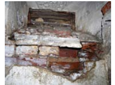
Per ventiliacinį langelį į rūšį tekėjo vanduo

Kurklių seniūnijos seniūnas Al- gimantas Jurkus džiaugėsi, kad pa- galiau pavyko tinkamai atnaujinti kapinių koplyčią, dėl kurios remonto būtinumo jis ne kartą tarėsi ir su Kur- klių bažnyčios dvasininkais. „O alto- rius kol kas padėtas seniūnijos gara- že, - sakė seniūnas, - pasitelkę meistrą mes jį suremontuosime ir pastatysime koplyčioje. Beje, suremontuotos ko- plyčios duris saulėtomis valandomis laikome atviras, kad gerai išdžiūtų rūšys“.