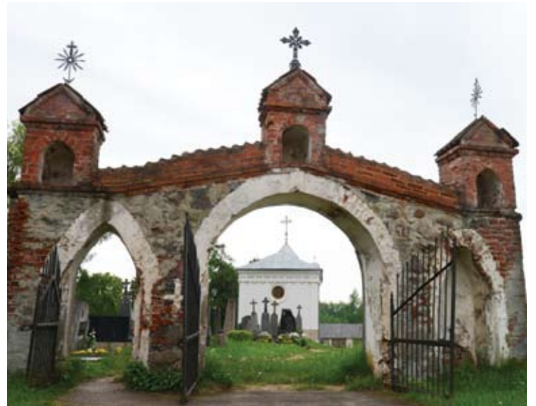
Už senųjų kapinių vartų - koplyčia.

Koplyčia buvo apirusi, persismel- kusi drėgme. Vanduo pateko ir į ko- plyčios rūšį, kuriame laidoti Pavirin- čių dvaro savininkų šeimos atstovai.