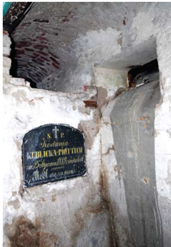
Taip atrodė rūšys prieš remontą.

– XIX amžiaus viduryje Pavirinčius valdė Antanas Kulbinskis-Piotuchas, Pavirinčių dvare gyvenęs iki pat mirties 1880 metais. Užpraeito amžiaus viduryje statytos koplyčios rūsyje ir buvo laidojami šios giminės atstovai“.