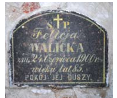
Vienas palaidojimų, datuo- jamas 1900 metais.