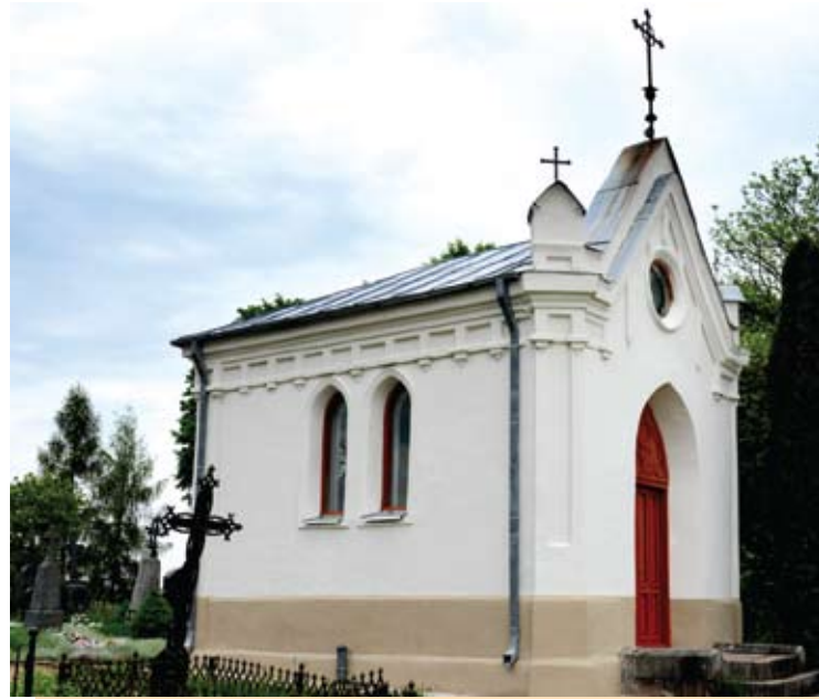
Senosiose Kurklių kapinėse šviečia atnaujinta koplyčia.

Individualios įmonės „Bėruva“ statybininkai atnaujino laiko tėkmės paveiktą Kurklių kapinių koplyčią, įrengė rūšio ventilia- ciją. Beliko į vietą pastatyti altorių.