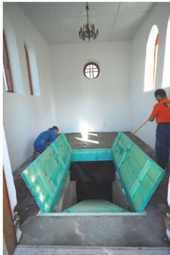
Statybininkai iš naujo išliejo grindis, pakeitė duris.